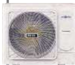
3,2HP HCNU 1056 XRV