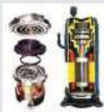
Compresseur DC Inverter

L'utilisation du moteur DC Inverter pour le ventilateur garantit des économies d'énergie lors des charges partielles, car il régule la vitesse du ventilateur et contribue à rendre l'unité plus silencieuse. La conception du ventilateur et de la grille d'évacuation garantit une augmentation du débit d'air résultant en un faible niveau sonore.