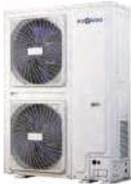
HCYU 2006 XRV HCYU 2806 XRV HCYU 2246 XRV HCYU 3356 XRV HCYU 2606 XRV

Toutes les unités sont équipées de compresseurs Full DC Inverter à haute efficacité.