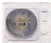
HCNU 1056 XRV HCNU 1206 XRV