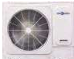
HCNU 1406 XRV HCNU 1606 XRV

Toutes les unités sont équipées de compresseurs Full DC Inverter à haute efficacité.