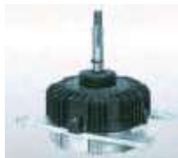
Moteur ventilateur DC Inverter