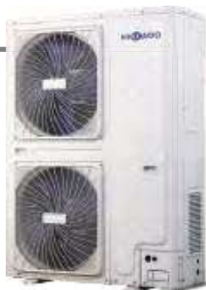
7HP HCYU 2006 XRV