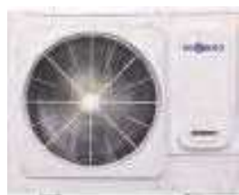
5HP HCNU 1406 XRV